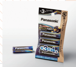
経済産業大臣賞 (乾電池エボルタ・エボルタネオンリズ エシカルパッケージ) パナソニック エナジー株式会社