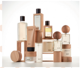
日本パッケージデザイン大賞 (BAUM) 資生堂

パッケージというデザイン領域のプロフェッショナルが集い、作品のデザイン性や創造性を競うコンペティションです。生産や流通、環境などの包装材料としての面だけでなく、デザイン的な価値や、商品づくりの観点にも重きを置きながら、パッケージデザイナーの目で評価することも、大きな特徴となっています。