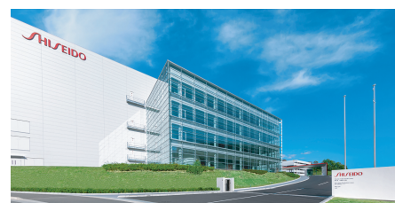
大阪茨木工場 / 大阪府茨木市彩都もえぎ1-4-1

●午前の部、午後の部、共に先着順です。 定員になり次第締め切らせて頂きます。申込みの際はどちらかを選択ください。