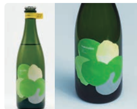
haccoba はなうたホップス / summit