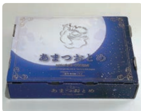
あまつおとめ / アンドマーク