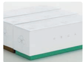
Ohagi3 小豆山水 / catamari