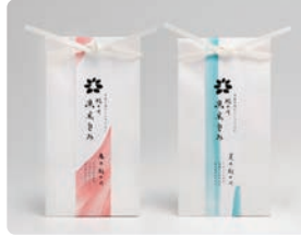
紀の川 黒米包み / marii