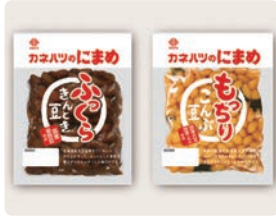
カネハツのにまめ / 大日本印刷