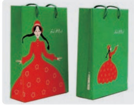
あんカラット / ホソカワデザイン