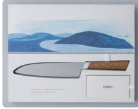
KISEKI / デザインパートナー