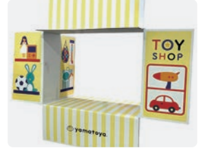
大和屋 遊べるギフトBOX「あそぼくす」 / レンゴウ