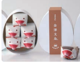
清香室町 金澤文鳥 / マンバラ