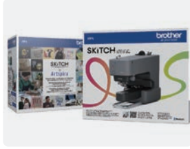
SKITCH PP1 / ブラザー工業