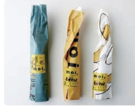
moi / デザイン事務所ルート