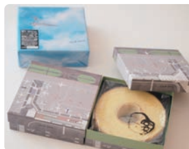
CLUB HARIE / 小野デザイン事務所