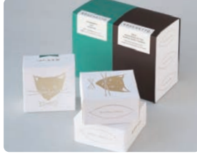
バスケット / トーン