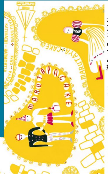
お菓子の包み紙 甲斐みのりのり